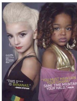
The Source, mars 2006

Inscription préalable par email wwsf@wwsf.ch ou par téléphone 022 738 66 19